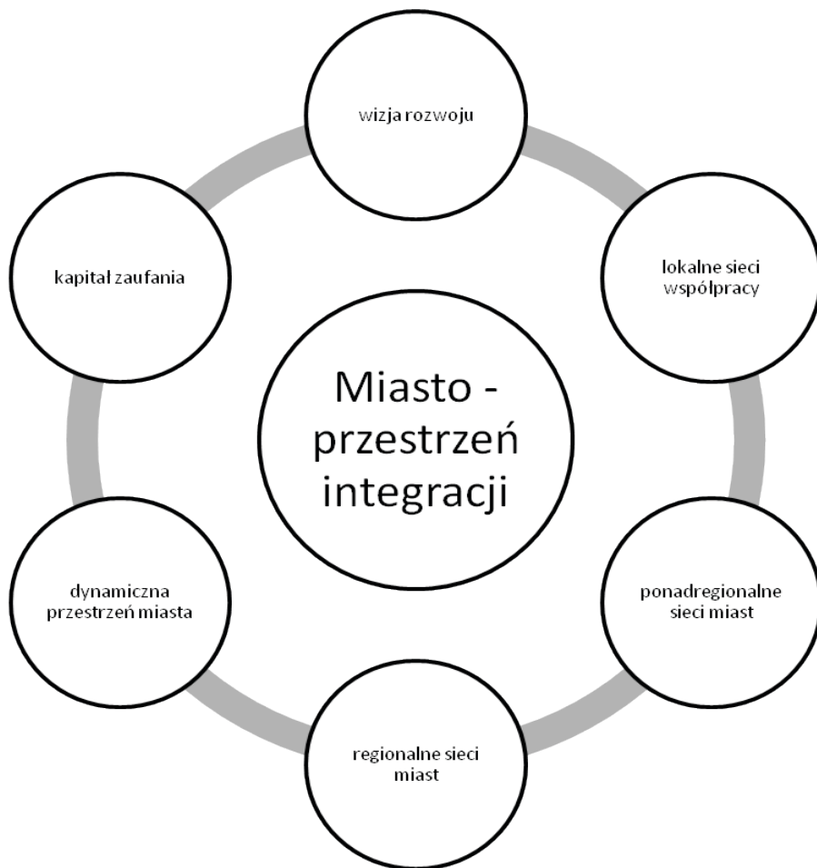
Rys. 1 Miasto jako przestrzeń integracji